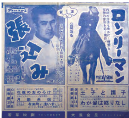
昭和33年、若草映画劇場（門司）のプログラム

日のようにあちこちの映画館に行っていました。門司だけではなく、小倉にも足を伸ばしていましたよ。