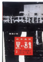
『黒い画集2』 昭和34(1959)年12月 光文社刊(「紐」収録)

「それはKという俳優が主演で、平手造酒の役でした。最初の場面は…」 静子は話したが、映画が好きだとみえて、なかなかたのしそうな表情であった。(「紐」)