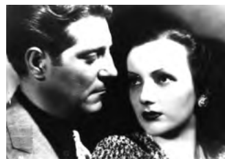
『望郷』 1937年制作 フランス ジュリアン・デュヴィヴィエ監督

清張は青年期から小倉でたくさんの映画を観ており、洋画をはじめとする映画ファンでした。邦画では、溝口健二監督の『浪華悲歌(エレジー)』や『祇園の姉妹』などをその社会的リアリズムに共感して観ていました。