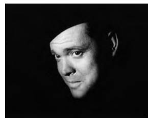
『第三の男』 1949年制作 イギリス キャロル・リード監督