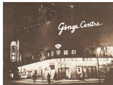
新世界映劇(昭和32年11月)