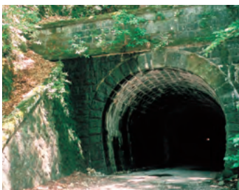
旧天城トンネル（天城山隧道）北口

何か話しているのが見えた。「私はそのまま歩いて、トンネルの中にはいった。それから、やっと湯ヶ野あたりの灯が下の方に小さくちらちら見える片側に出た。」