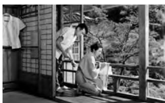
『張込み』 制作:松竹・大船 公開:1958年1月 監督:野村芳太郎 脚本:橋本 忍