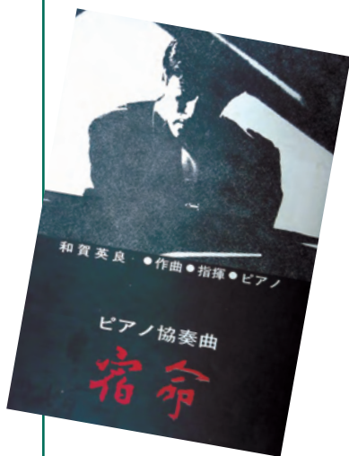
和賀 英良の演奏会プログラム 仕立ての小道具