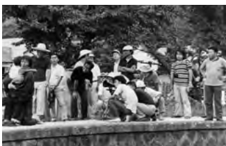
『砂の器』撮影風景 制作:松竹=橋本プロ 公開:1974年10月 監督:野村芳太郎 脚本:橋本 忍・山田洋次

『砂の器』、『張込み』、『黒い画集 あるサラリーマンの証言』は清張自身が高く評価し、『キネマ旬報』でも高い順位を獲得した名作です。