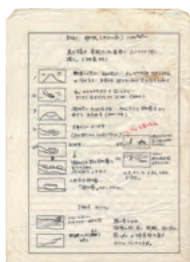
『砂の器』絵コンテ 野村芳太郎監督自筆の絵コンテ 野村芳樹所蔵