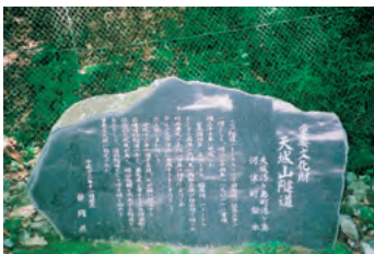
重要文化財 天城山隧道 記念碑

それはトンネルの入口が遠くに見えるところだった。女は、急に「兄さん、悪いけれど、あなた、先に行つて頂戴」と言った。「あのひとにぜひ話があるんでね、先に行つて頂戴。話がすんだら、また、兄さんに追いつくからね」と、やさしい目つきをした。「私」はとほとほと暗い峠を登つた。土工の横をすり抜けて先に出た。ふりむくとあの女が、土工と