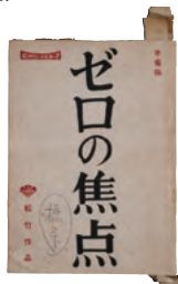
『ゼロの焦点』 台本・準備稿(橋本忍用) 橋本忍記念館所蔵