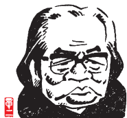
イラスト：山藤 章二