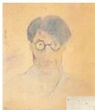
中島 敦 「自画像」 ※県立神奈川近代文学館所蔵