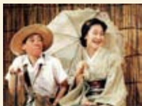
「花みづきの会」 前進座劇場公演より