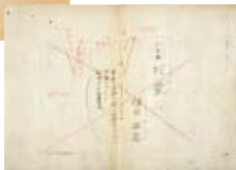
埴谷 雄高 「死霊」巻頭言 原稿 ※豊田市立中央図書館所蔵