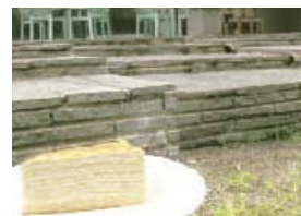
これも出逢い。品切れの場合はご容赦ください。

記念館ができるまで長年土に埋もれていた小倉城の石垣、2,400万年前の眠りから覚めた火山岩・鉄平石、そして松本清張。出逢いは複雑にからみながら見せる、見事な調和。来館の際にはどうぞお気軽に散策してみてください。