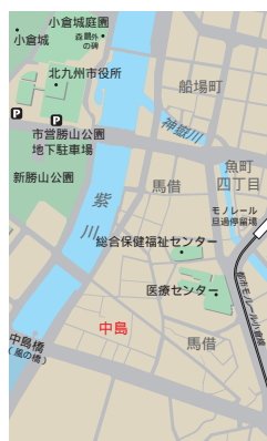
現在の中倉市街地図

「その年の暮から、父は橋の上に立つて塩鮭の立ち売りをしはじめた。それは市場から帰る客を目当てにしたものだが、市場のものよりはいくらか安かつたとみえ、予想外の商売になつたらしい。このことから、ようやく奥田家の間借りから解放され、私たちは中島という市外地のみすばらしい借家に移つた。」(「半生の記」)借家があつた中島は、もとは紫川と神獄川に挟まれた三角州で、葦の生えた沼地を埋め立て、紫川の中の島の形をなしていたことにちなんで「こつ呼ばれた」と言う。清張は、借家を「骨壺の風景」の中で、「一つの板壁の小屋を家主が一軒の貸家に分け、一軒が六畳と板の間しかなく、出入口の戸を開けたらすぐ前に一軒共用の便所があつたと記している。」 「小倉の中島にあるバラックの家の前に