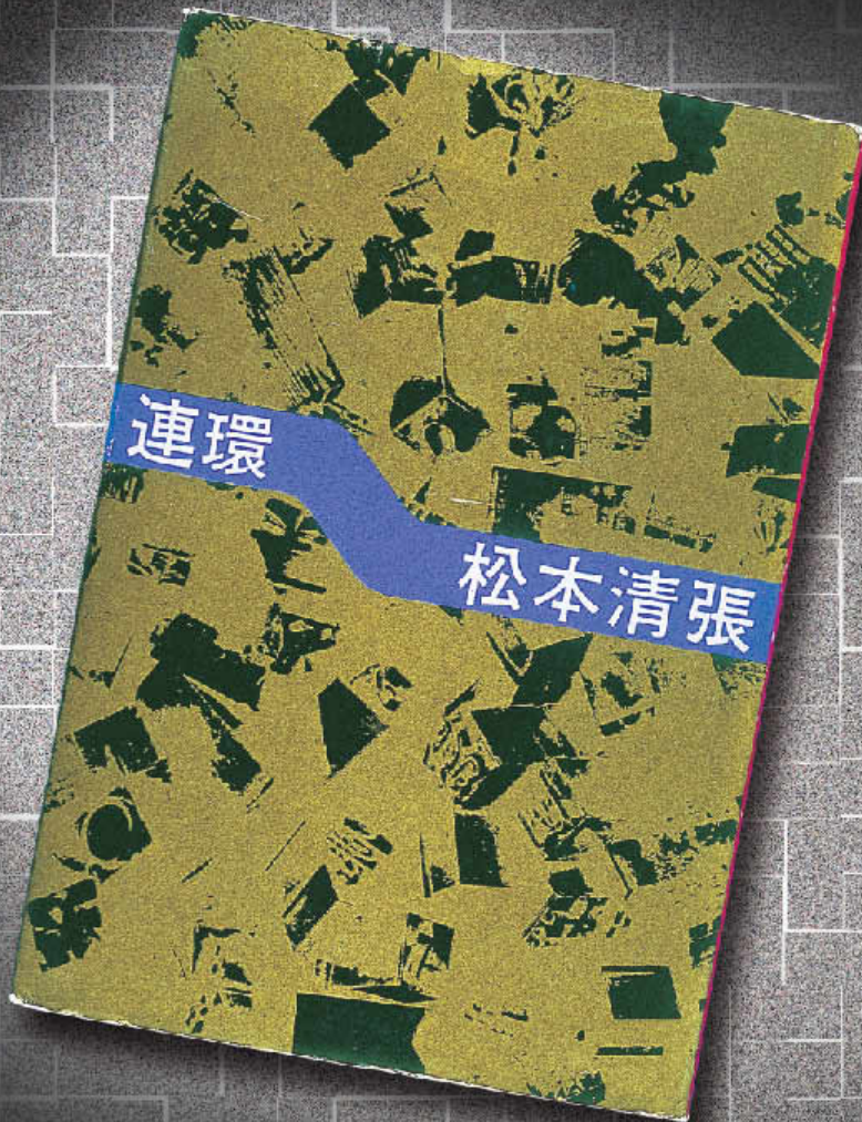
『連環』 昭和37年11月 講談社

現在入手できる本 『松本清張全集 第12巻 文藝春秋』 『連環』講談社文庫 講談社)