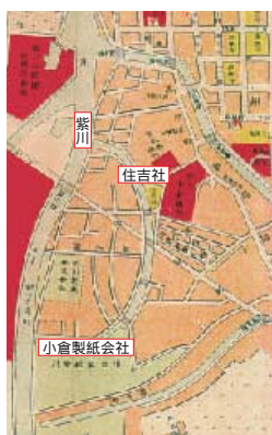
大正8年中倉市街地図