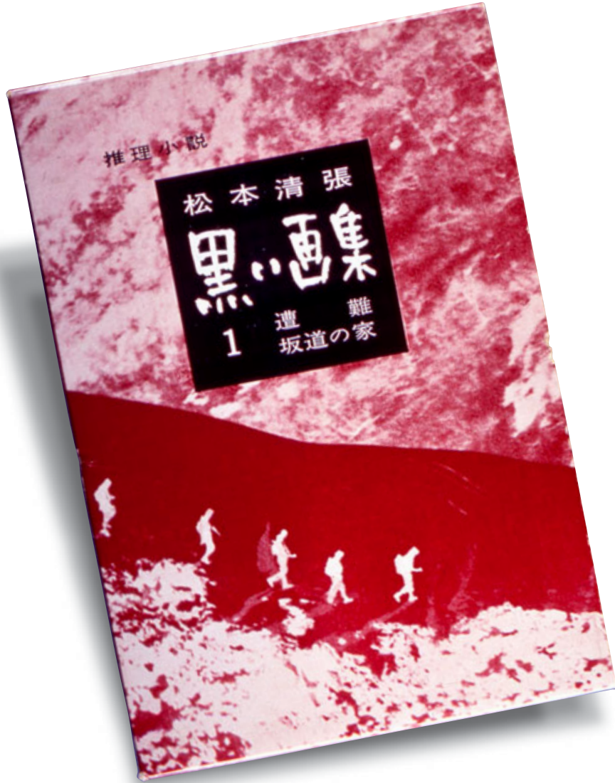
昭和34年(1959)4月初版 光文社

『黒い画集』は昭和三十三年十月五日から三十五年六月十九日まで『週刊朝日』に連載。「遭難」「証言」「坂道の家」など九つの推理小説の中短篇の連作であった。単行本に収められるとき、そのうちの「失踪」が外され、「天城越え」(『サンデー毎日』特別号11 昭和三十四年十月)が加えられた。現在入手できる本