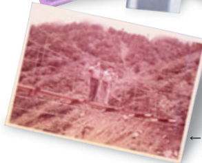
←「遭難」 取材登山の写真

〈主な展示品〉 『黒い画集』著書、「遭難」取材登山の写真、『随筆 黒い手帖』（『紙の登攀』収録）など