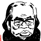
イラスト:山藤 章二