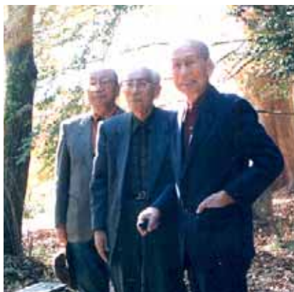
昨年11月 友の会のメンバーと大分富貴寺で

二松学舎専門学校(現・二松学舎大学)卒業。 下関工業、戸畑高女、戸畑高校教員を経て昭和28年から門司市立図書館に勤務。昭和50年北九州市立中央図書館創立にともない同館に転任。北九州資料室担当。元梅光女学院大学助教授。現在、松本清張記念館運営委員、郷土史家。大正10年門司生まれ。