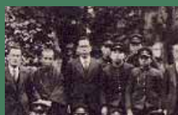
倉敷実業学校時代文芸部顧問として