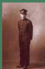
東京帝国大学入学のころ