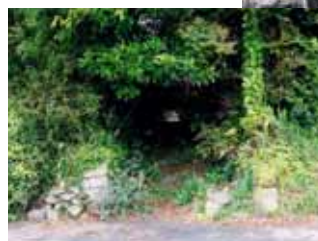
← 鶴田知也の旧宅 現在は廃屋となっている。