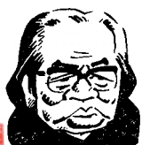
イラスト：山藤 章二

館報が第9号、研究誌が第3号。 いよいよ頑張るのみです。 皆さんの声、意見をお寄せください。 (中野 吉明)