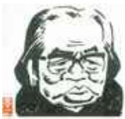
イラスト:山藤 章二