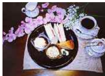
◀人気の「石の館庭園」このほか軽食、弁当(要予約)なども。

きよし ところで、今度「記念館友の会」に入ったんだけど、会員には1割引の特典付きなんだって。だからこの支払いは、僕にまかせといて!