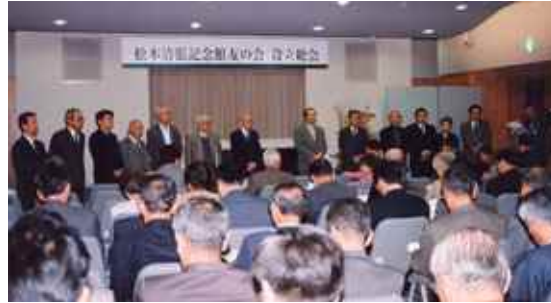
総会、役員紹介の様子

今年8月から会員募集を開始した友の会の設立総会が記念館で行われました。会員数は375名(11月21日現在)、全国からたくさんの申し込みがありました。当日の総会出席者は約100名、遠くは岩手県からの参加もあり、熱気ある会となりました。