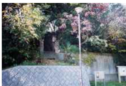
● 榎山荘跡 小倉北区・中井浜(中井北公園付近) JR鹿児島本線「九州工大前」駅下車