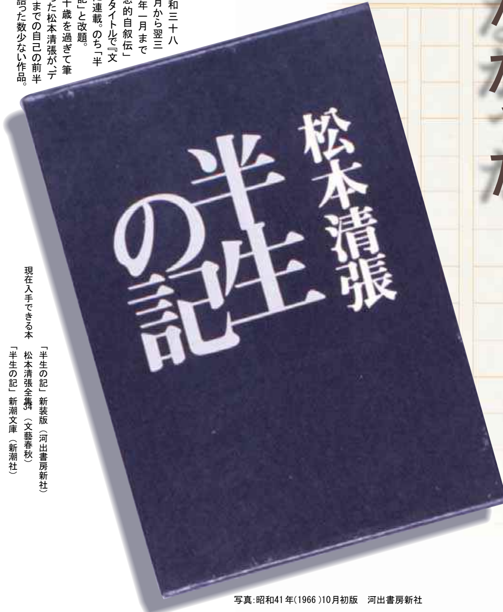
写真:昭和41年(1966)10月初版 河出書房新社

昭和三十八年八月から翌三十九年一月まで「回想的自叙伝」というタイトルで『文藝』に連載。のち「半生の記」と改題。四十歳を過ぎて筆を執った松本清張がデビューまでの自己の前半生を語った数少ない作品。