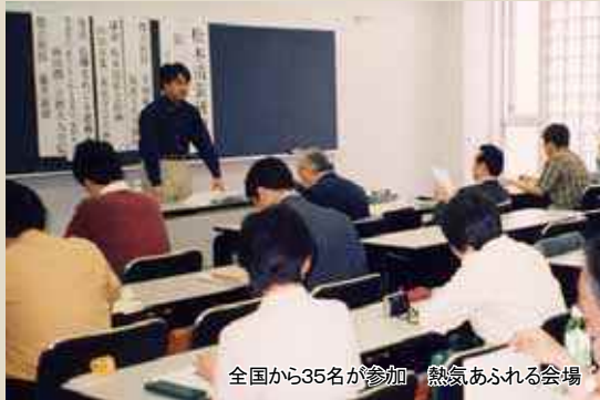
全国から35名が参加 熱気あふれる会場