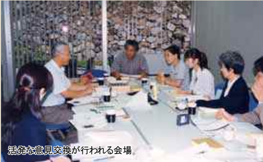
活発な意見交換が行われる会場