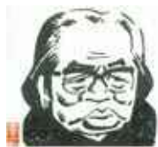
イラスト:山藤 章二

〒803-0813 北九州市小倉北区城内2番3号 TEL 093(582)2761 FAX 093(562)2303 http://www.kid.ne.jp/seicho 制作 (有)エディックス